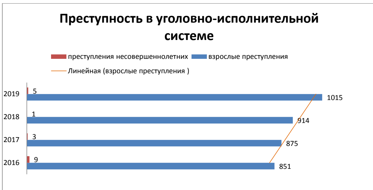
Рис. 2.2. Количество преступлений, совершенных в исправительных учреждениях за 2016-2019 гг.

Также необходимо указать, что за последние годы количество преступлений, совершенных в исправительных учреждениях неуклонно растет (Рис. 2.2).