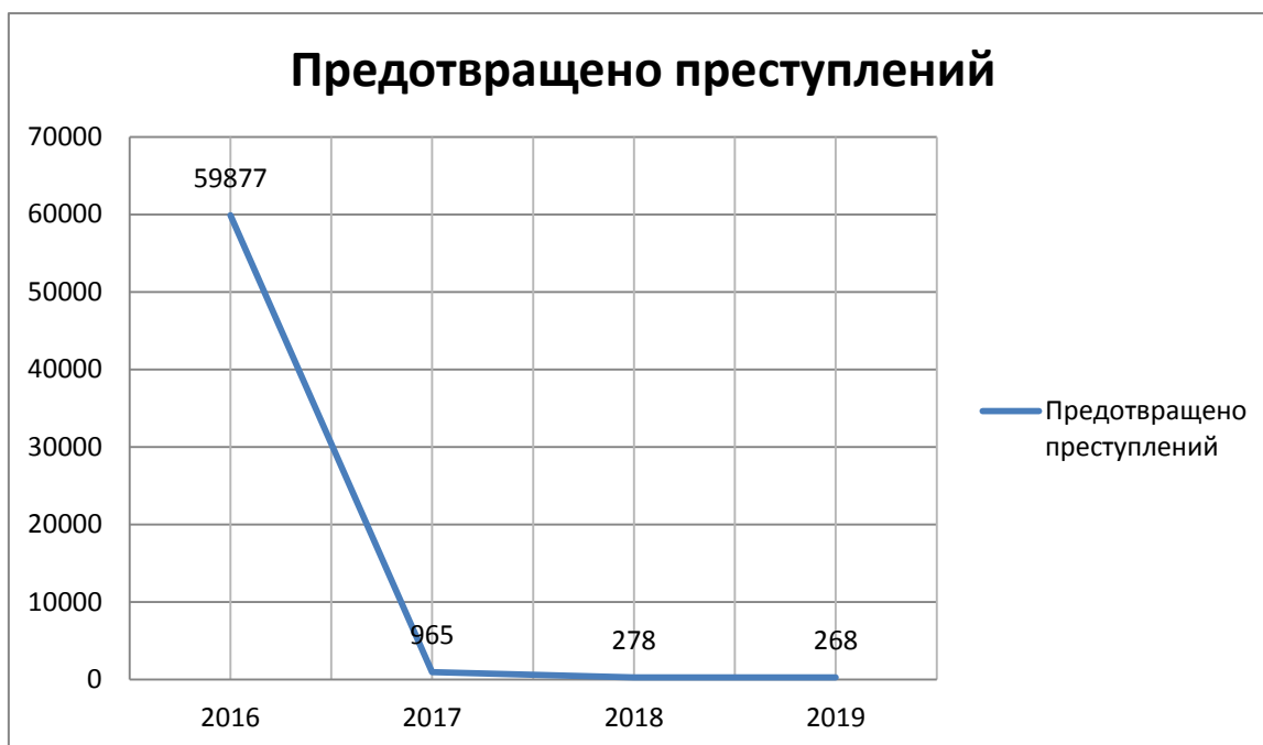
Рис. 2.3. Количество преступлений, предотвращенных в исправительных учреждениях УИС

Из приведенного видно, что количество предотвращенных преступлений неуклонно снижается, тогда как совершенных, растет.